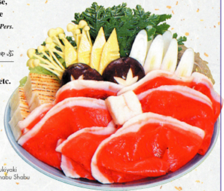
Suki-yaki Shabu Shabu