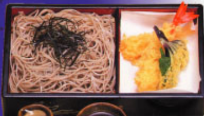
Ten Mori Soba

Buchweizennudelsuppe mit Krevetten - Tempura 25.00